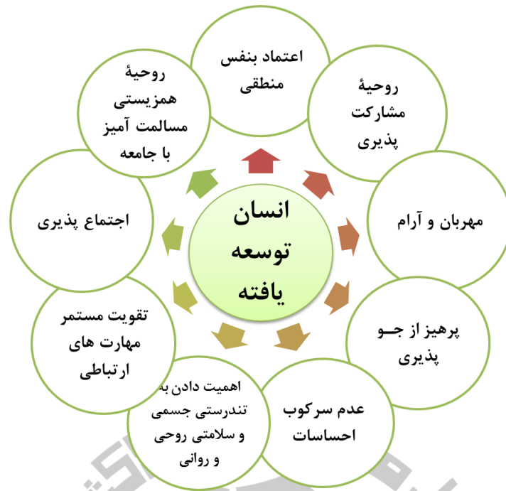
شکل (۱): ویژگی های انسان توسعه یافته از نظر دکتر سید علی میر باقری