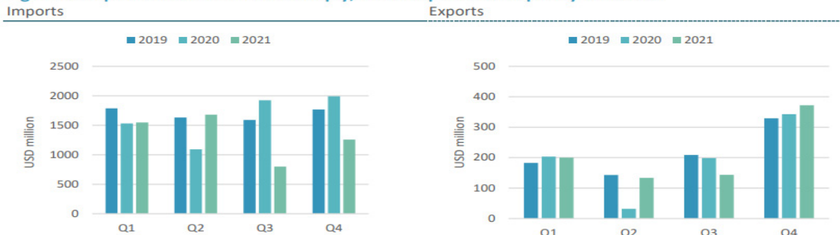
Figure 9: Imports have contracted sharply, while exports have quickly recovered