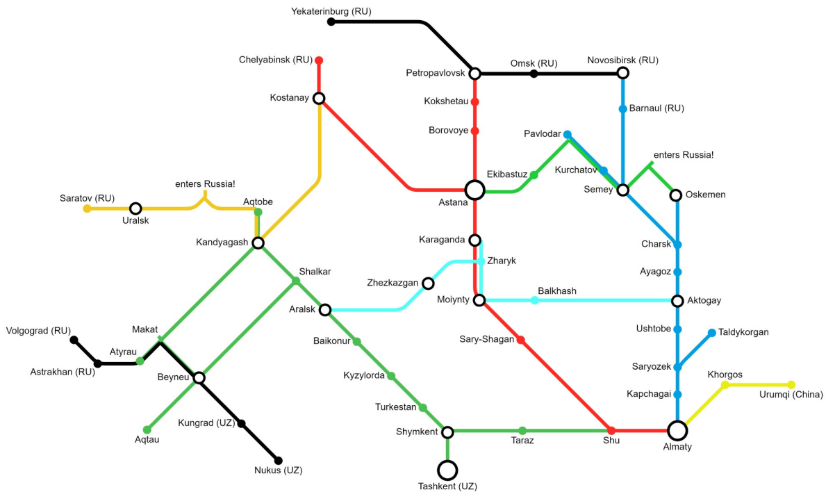
Passenger railway map of Kazakhstan*

در زمینه گسترده‌تر تقویت زیرساخت‌های راه‌آهن قزاقستان، تلاش‌هایی برای ساخت خطوط دوم در بخش راه‌آهن Dostyk-Moiynty در حال انجام است. هم‌زمان، طرح‌هایی برای خطوط راه‌آهن بختی-ایاغوز و دربازا-مکتارال در حال انجام است که مجموعاً بیش از ۱,۳۰۰ کیلومتر بر طول خطوط راه‌آهن قزاقستان طی سه سال آینده می‌افزاید. ایستگاه آلماتی در نقشه ذیل در قسمت پایین سمت راست قابل مشاهده است. این ایستگاه راه‌آهن قزاقستان را به منطقه قورغاص به عنوان مهمترین منطقه ویژه اقتصادی چین-قزاقستان و به اورومچی مرکز سین کیانگ چین متصل می‌کند. ایستگاه آلماتی مهمترین هاب مسیره‌های ریلی ابتکار کمربند و راه در خارج از چین محسوب می‌شود.