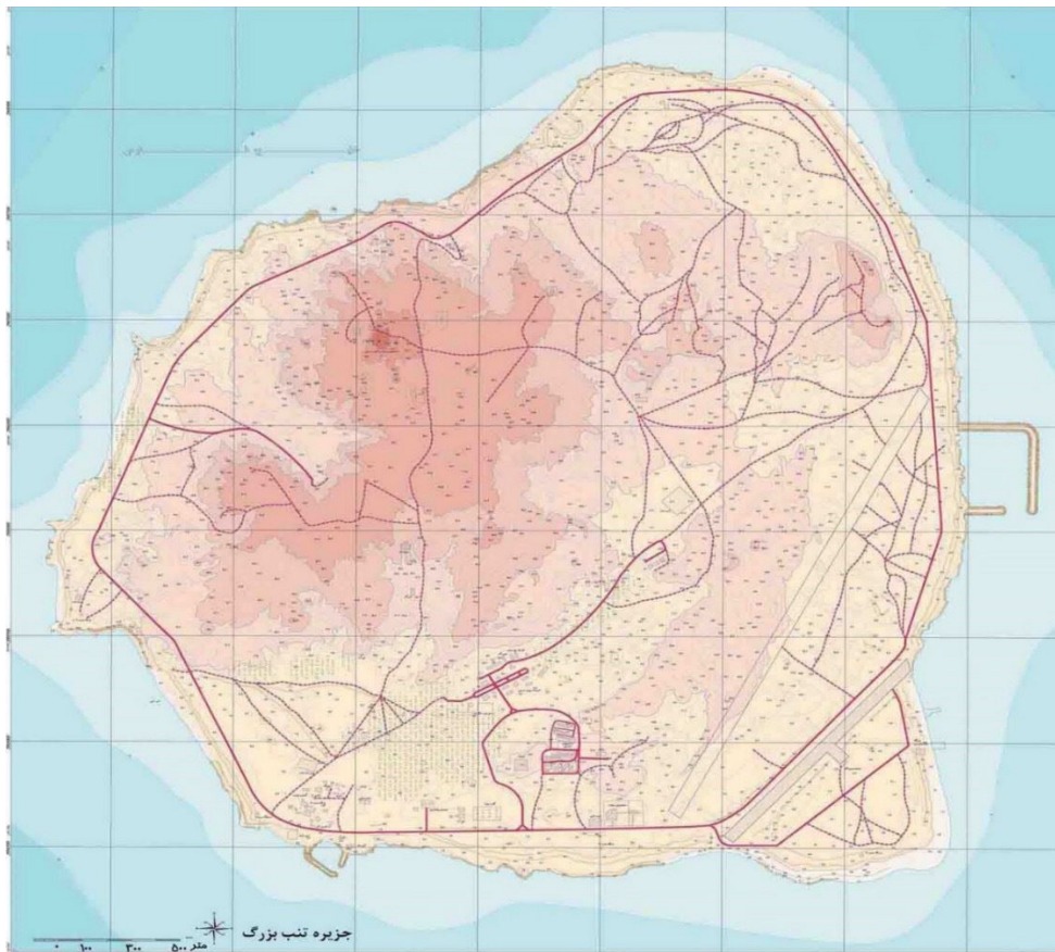
نقشه ۴: جزیره تنب بزرگ

جزیره تنب بزرگ یکی از جزایر ایران و بخشی از شهرستان ابوموسی است که در ۹۷ مایل دریایی معادل ۱۷۹٫۶ کیلومتری از جنوب غربی شهر بندرعباس مرکز استان هرمزگان قرار دارد. این جزیره از شمال با ساحل جزیره قشم حدود ۲۹ کیلومتر، از شمال غربی با شهر بندرلنگه با ۵۱ کیلومتر، از غرب با معادل ۱۳ کیلومتر از جزیره تنب کوچک و از جنوب غربی ۵۳ کیلومتر از جزیره ابوموسی فاصله دارد. فاصله این جزیره تا بندر شارجه در امارات متحده عربی ۱۰۰ کیلومتر ۱ است. مساحت این جزیره نیز حدود ۱۰٫۵ کیلومتر مربع است.