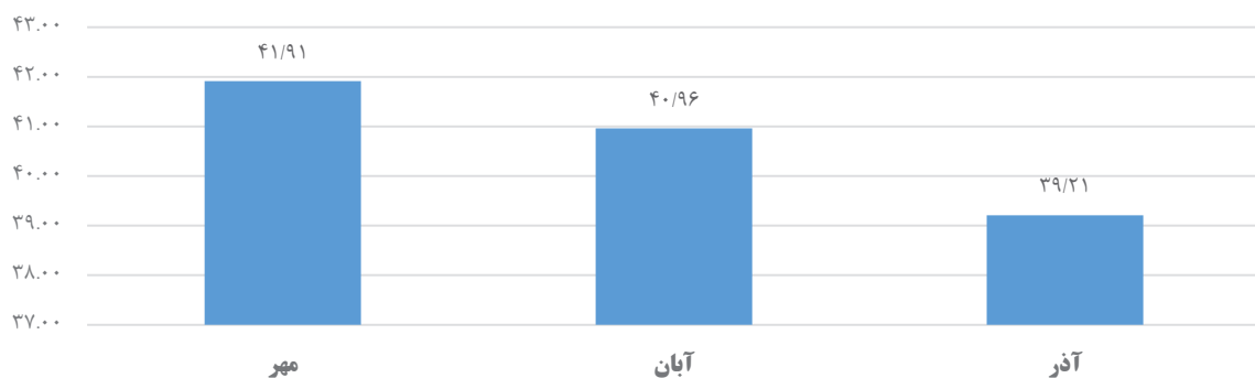
نمودار شامخ فصل پاییز