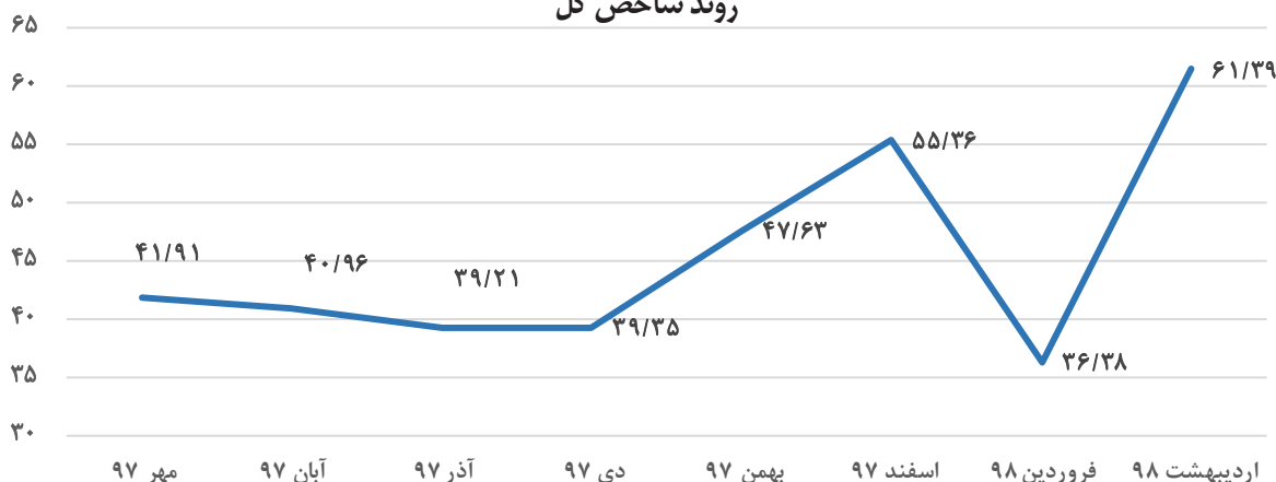
روند شاخص کل