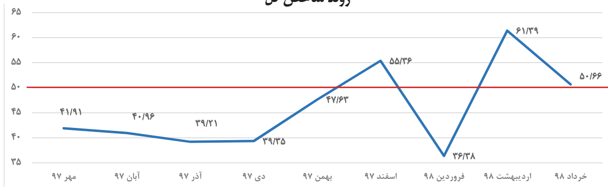
روند شاخص کل