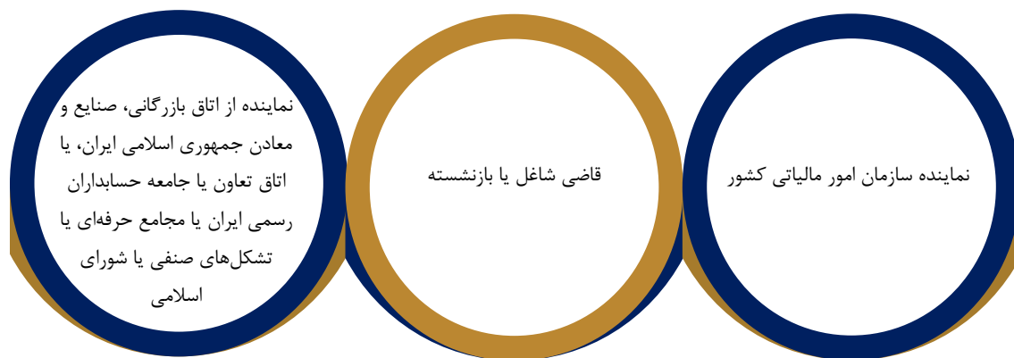
شکل ۱. ترکیب هیات‌های حل اختلاف مالیاتی موضوع ماده ۲۴۴ قانون مالیات‌های مستقیم

دادرسی مالیاتی به‌طور عمده توسط هیات حل اختلاف مالیاتی ۵ انجام می‌پذیرد. ترکیب هیات حل اختلاف از ۳ نفر شامل نماینده سازمان امور مالیاتی، قاضی شاغل یا بازنشسته و نماینده اتاق بازرگانی، صنایع، معادن و کشاورزی و یا تشکل‌های صنفی به انتخاب مودی تشکیل شده است. این هیات موظف است با حضور تمام اعضا به اعتراض مودی که به‌طور مستقیم و یا از طریق رئیس امور مالیاتی ارجاع شده است، رسیدگی و تصمیم‌گیری نماید.