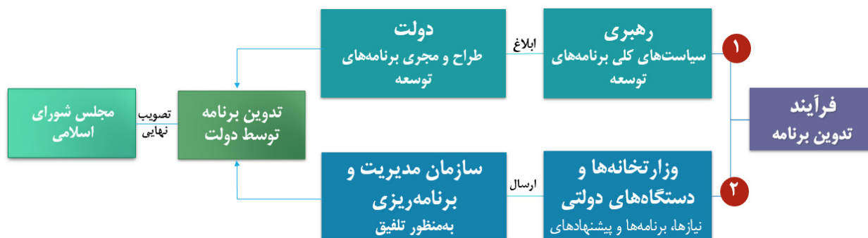
شکل ۲- فرآیندهای تدوین و تنظیم برنامه‌های توسعه

این فرآیند که طی چرخه عظیمی شامل رهبری، مجمع تشخیص مصلحت، دولت و مجلس انجام می‌شود، دارای ضروریاتی می‌باشد که عدم رعایت آنها سبب بروز برخی از مشکلات خواهد شد. در ادامه به بررسی این آسیب‌ها پرداخته شده است.