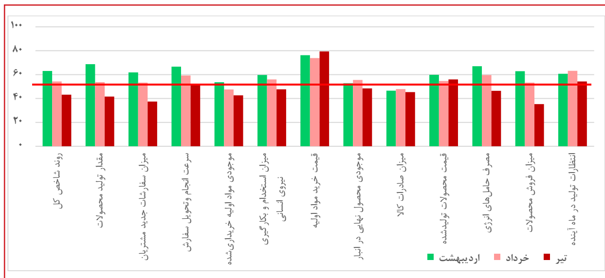
نمودار ۳: مقایسه شاخص‌های بخش صنعت در سه ماه منتهی به تیر ۱۴۰۰