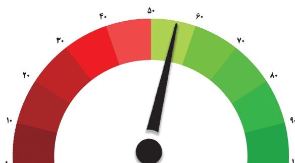
شاخص صنعت - دوره سی و ششم