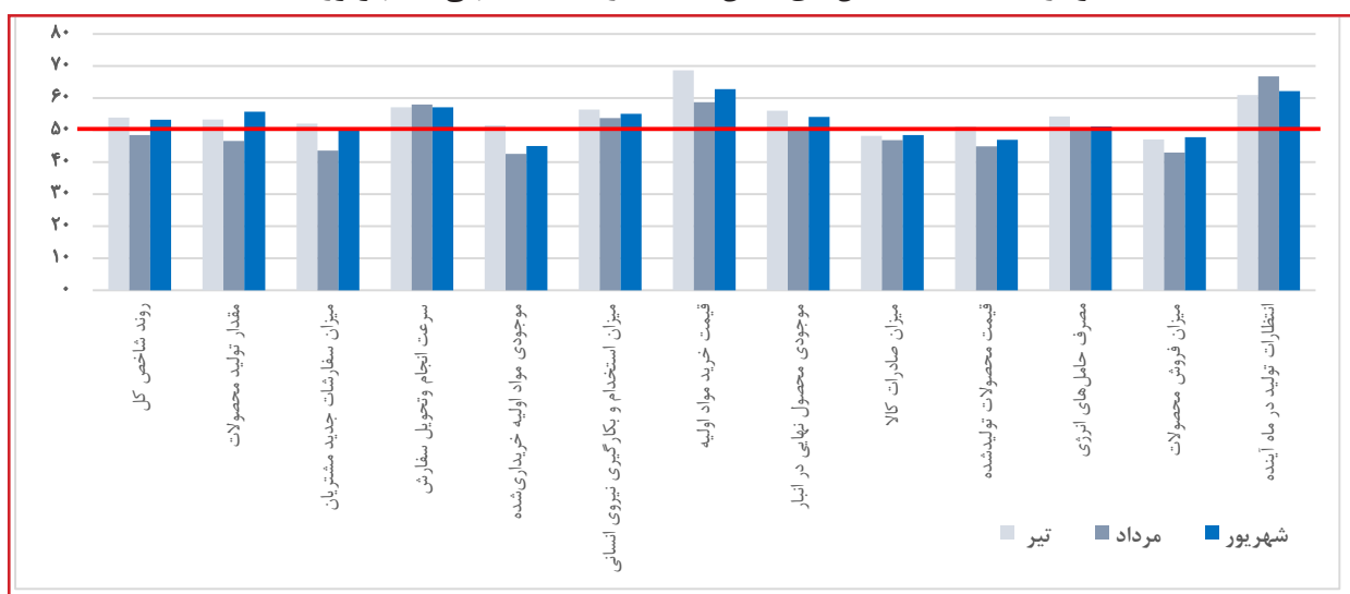
نمودار ۳: مقایسه شاخص‌های بخش صنعت در سه ماه منتهی به شهریور ۱۴۰۱