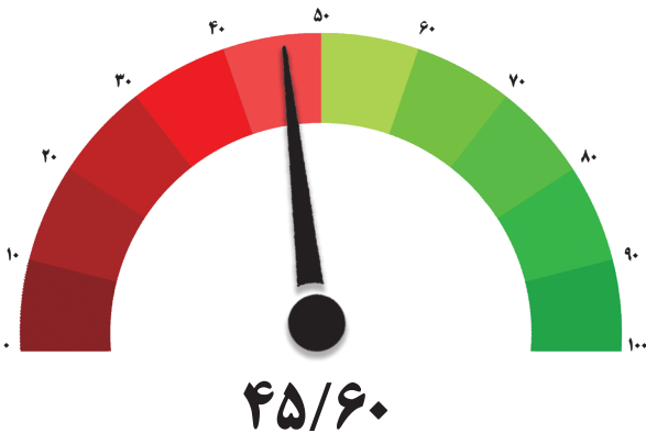
شاخص صنعت – دوره پنجاه و دوم

مرکز آمار و اطلاعات اقتصادی و پایش اصل ۴۴