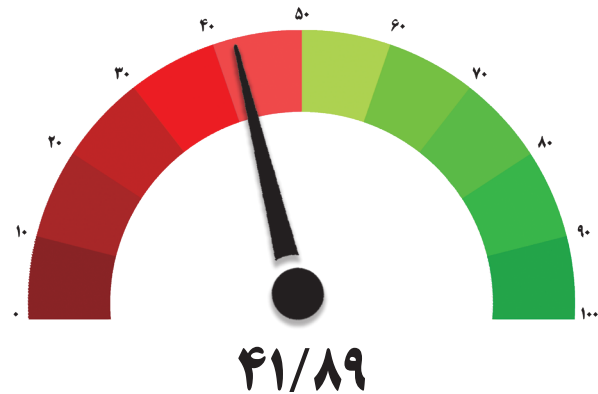
شاخص کل اقتصاد – دوره چهارم