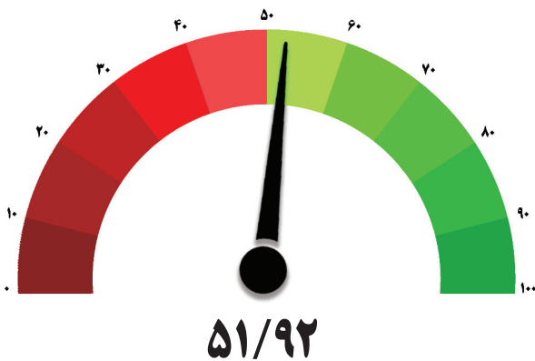
شاخص صنعت – دوره شانزدهم