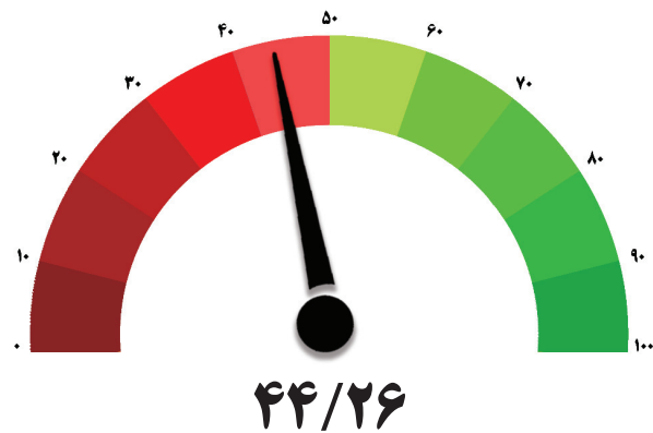
شاخص کل اقتصاد – دوره چهارم